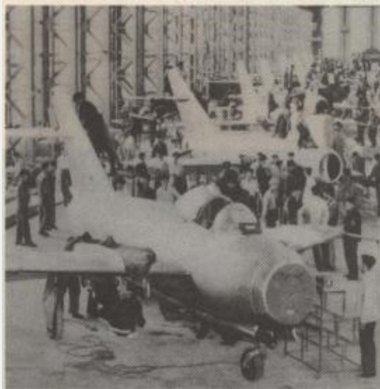
我国制造的第一批喷气式飞机

②成就：a. 到1957年超额完成经济指标；b. 先后建成四大重点企业（鞍山钢铁公司三大工厂、长春第一汽车制造厂、沈阳机床厂和飞机制造厂）。