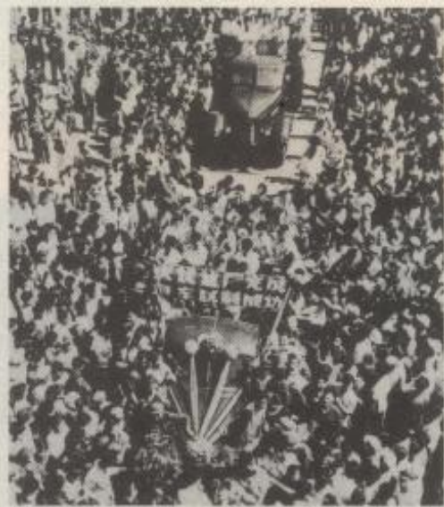
长春第一汽车制造厂生产的首批解放牌汽车