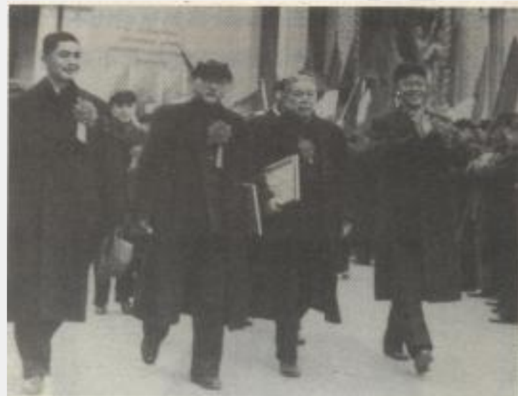
上海工商界申请全行业公私合营

“赎买”政策 ：指对资产阶级的生产资料通过和平方式并采取有偿办法实行国有化的政策。