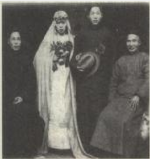
民国时期的新式婚礼