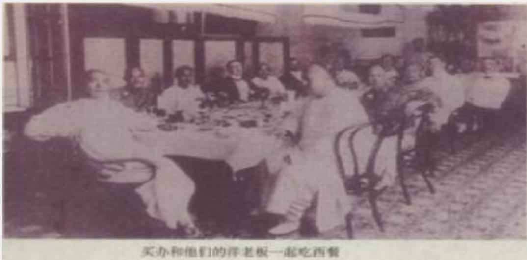
买办和他们的洋老板一起吃西餐

中方饮食追求美味为首要目的，以味为核心；西方饮食以营养为最高准则，讲求营养成分搭配。