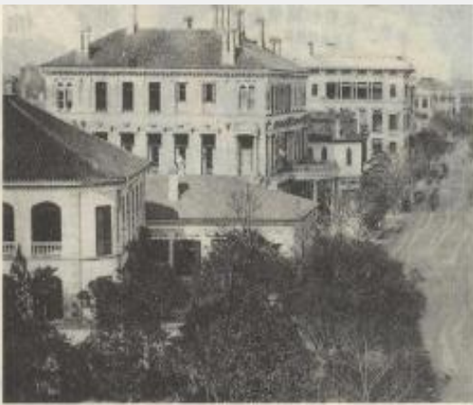
北京的传统四合院和新建的小洋楼