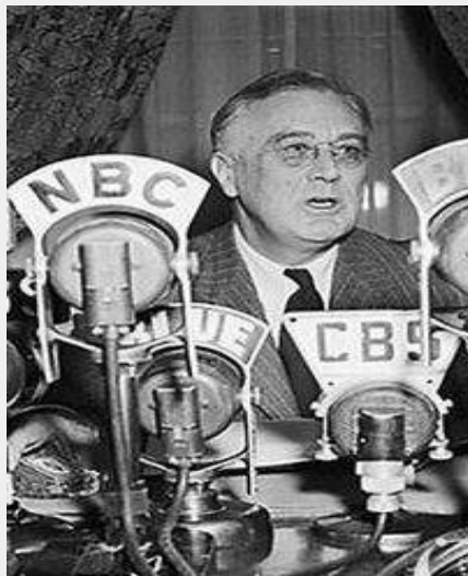
1929-1932年 成功竞选纽约州长， 并于1930年成功连任