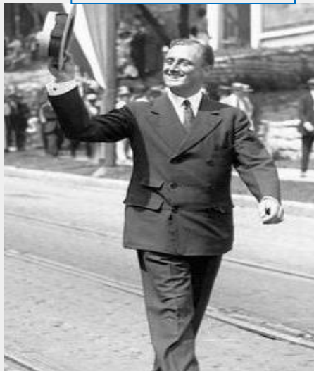
1920年 竞选美国副总统失败