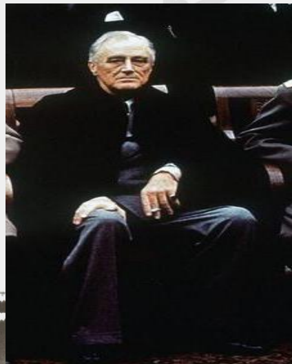
1933-1945年 1932年竞选美国总 统成功并连任四届