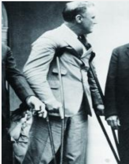
1921年 在加拿大休假时，患 上了脊髓灰质炎