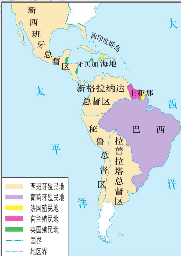
列强在拉丁美洲的殖民地(18世纪晚期)