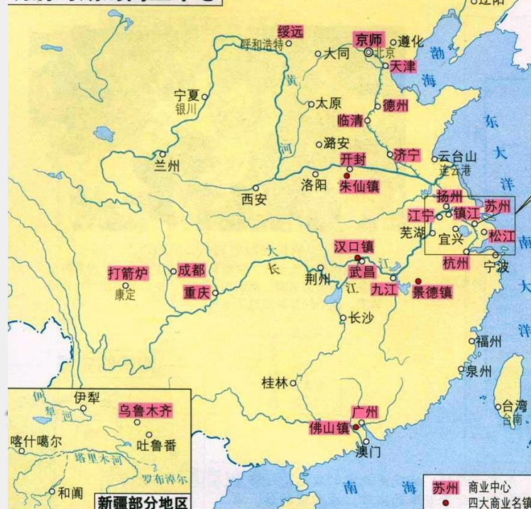
明清时期的商业中心