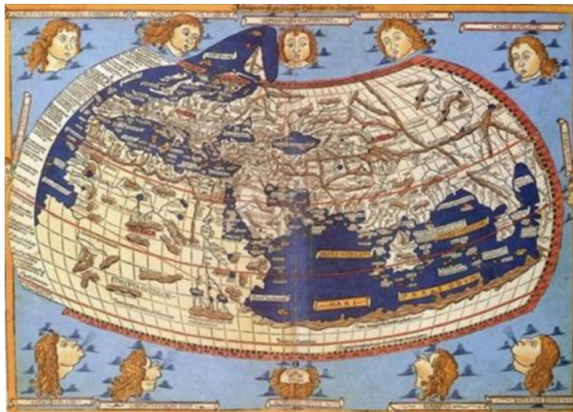
15世纪绘制的世界地图