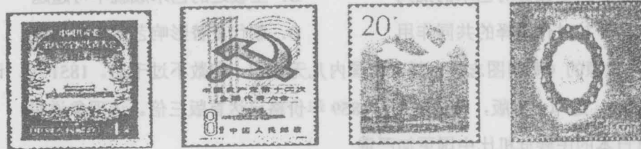
中共八大 中共十二大 中共十四大 中共十五大