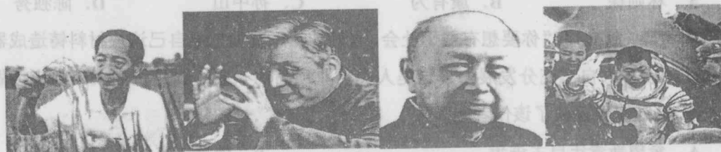
A. 袁隆平 B. 邓稼先 C. 钱学森 D. 杨利伟

15. 科学技术是第一生产力,科技的进步离不开科技工作者的无私奉献和勇于牺牲的精神。下列人物中为我国导弹、火箭和航天事业的创建和发展做出突出贡献的是