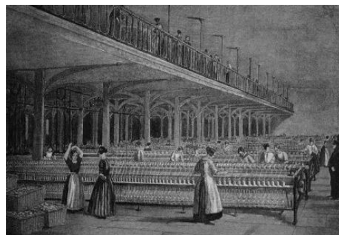
图二 18 世纪英国纺织工厂